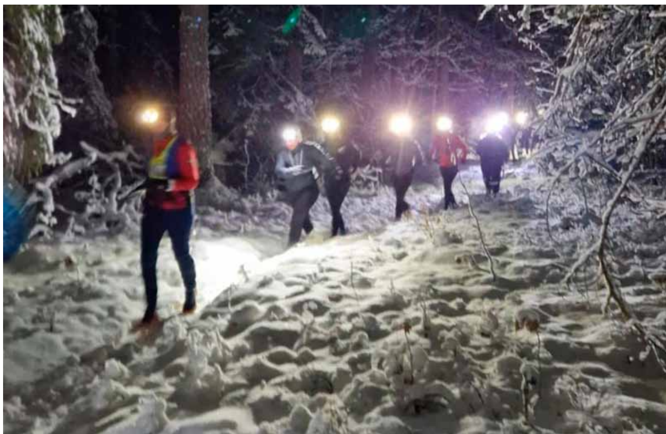
Uppstart Woodland Trail i Linköping i januari 2025 med 40 st tjejer!