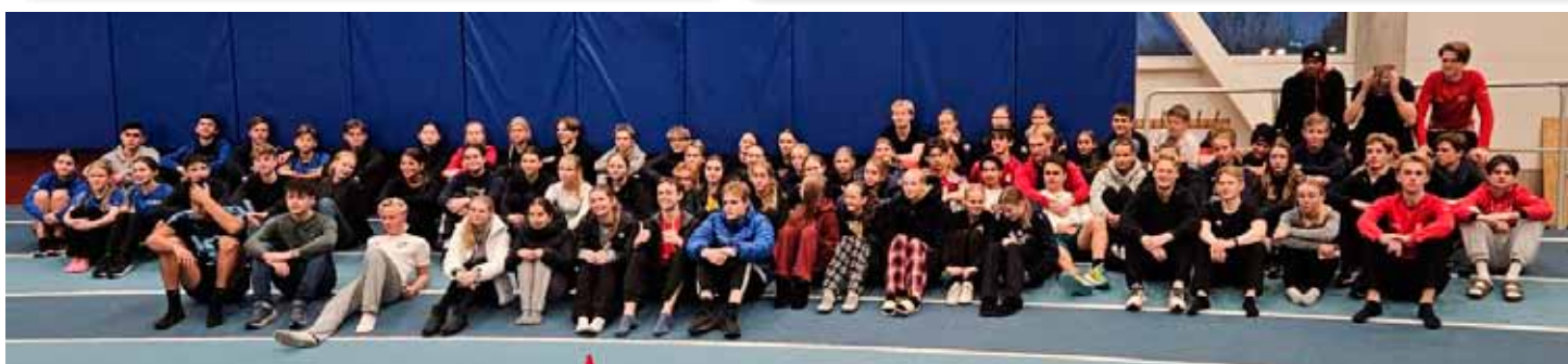
Några foton från Höstlägret i Norrköping.