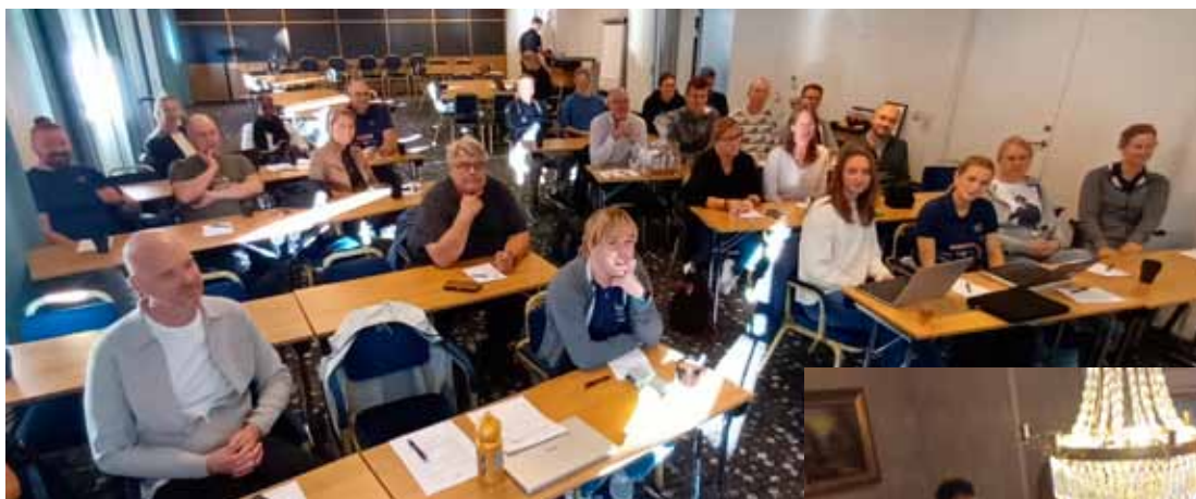
Höstmötet i Vadstena